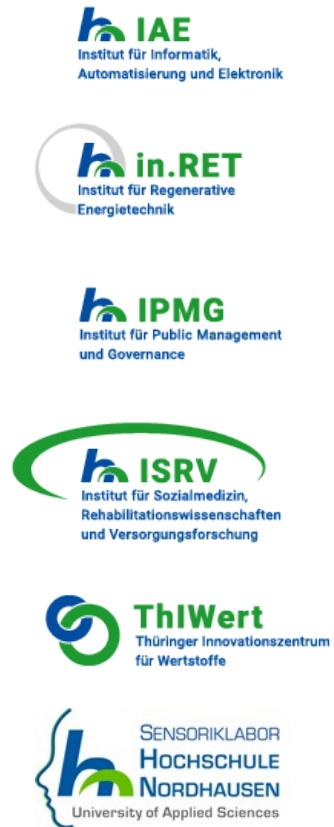
Abbildung 1: Forschungseinrichtungen und Institute der HSN

Studium und Lehre umfassen an der Hochschule Nordhausen insgesamt 15 Bachelorstudiengänge und zehn Masterstudiengänge, aufgeteilt auf die zwei Fachbereiche „Ingenieurwissenschaften“ und „Wirtschafts- und Sozialwissenschaften“. Neben der praxisnahen Bildung fühlt sich die Hochschule Nordhausen dem wissenschaftlichen Fortschritt verpflichtet, sodass FuE-Aktivitäten einen besonderen Stellenwert haben. Die Wissenschaftlerinnen und Wissenschaftler bzw. Lehrenden sollen einen engen und intensiven Kontakt zur regionalen Wirtschaft aufweisen und kompetente Lösungen für die unterschiedlichsten Fragestellungen aus Wirtschaft und Wissenschaft bieten. Dazu stehen fünf Institute sowie das Sensoriklabor als spezielle Einrichtung zur Verfügung (vgl. Abbildung 1).